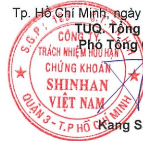
Kang Sang In